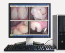
PC用ワイヤレス受信機【画像管理ソフト付】