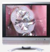
TV用ワイヤレス受信機